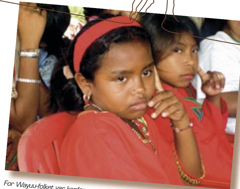
For Wayuu-folket var konferansen en så viktig anledning at skolene stengte i de dagene arrangementet pågikk, slik at også barna kunne delta.

I tillegg til deltakere fra Ecuador og Bolivia, deltok kvinner fra Mexico, Nicaragua, Guatemala, Bolivia, Chile, Peru og Argentina. Det neste målet er å arrangere et toppmøte for kvinner i forbindelse med det kontinentale toppmøtet for urfolk i Amerika-regionen, som skal gå av stabelen i Chile i 2009. Forberedelsene er allerede i gang. Kvinnetoppmøtet vil finne sted to dager før hovedtoppmøtet. Det er nedsatt arbeidsgrupper på forskjellige temaer som skal tas opp, for eksempel vold mot kvinner, likestilling, og kapasitetsbygging og opplæring i organisasjonsarbeid.