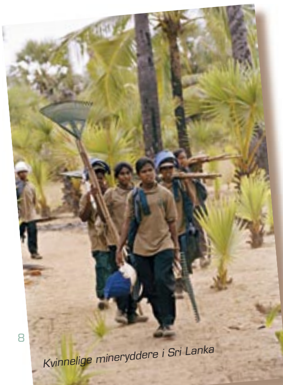
Kvinnelige mineryddere i Sri Lanka

I fremtiden tror Norsk Folkehjelp det blir mer samhandling med lokale myndigheter i mineryddingsarbeidet. Norsk Folkehjelp vil arbeide for å få nasjonale myndigheter til å vise kraft og evne til å løse problemet selv. Det vil føre til færre programmer som det Norsk Folkehjelp har på Sri Lanka i dag, med 500–600 egne folk i sving.