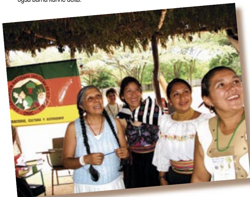
Vertskapet hadde bygget et stort tak over en åpen plass som hjalp mye i det varme og fuktige klimaet.