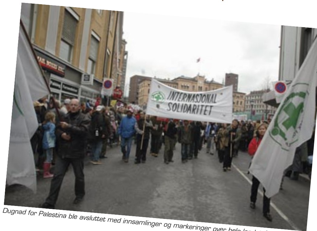
Dugnad for Palestina ble avsluttet med innsamlinger og markeringer over hele landet 1. mai 2007.

TV2s humanitære innsamlingsaksjon Artistgallaen var i september 2007 viet Norsk Folkehjelps arbeid. Programmet ble direkteendt fra Drammens Teater, med internasjonale artister og reportasjer fra våre prosjekter, og med et spesielt fokus på minerydding. I løpet av våren reiste våre fem ambassadører ut for å bli bedre kjent med Norsk Folkehjelps arbeid. Ane Dahl Torp og Ane Brun besøkte hundesenteret i Bosnia-Hercegovina, Erik Thorstvedt traff mineofre i Libanon, Minken Fosheim møtte kvinnelige mineryddere i Sør-Sudan og Solveig Kloppen besøkte landsbyer i Kambodsja. I forkant av Artistgallaen ble det også utarbeidet en ny giverordning – folkehjelper.no – og i løpet av gallaen kom det inn 3000 nye faste givere til Norsk Folkehjelps arbeid.