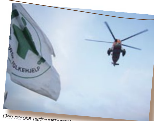
Den norske redningstjenesten er et samarbeid mellom frivillige redningsorganisasjoner og det offentlige og private.

Norsk Folkehjelp har avgitt høringsuttalelse og møtt i stortingskomiteen for å gjøre rede for vårt syn. Vi er fornøyde med at vi har fått en stortingsmelding som tar opp hele spekteret av frivillighet og som samlet ser på de utfordringene vi har. Vi er spesielt positive til tanken om at det offentlige skal samordne seg bedre i møte med frivilligheten.